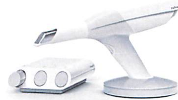
Intraoralscanner TRIOS® von 3Shape